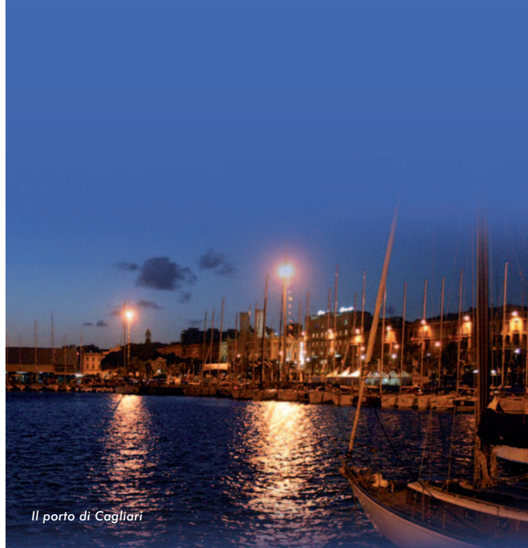
Il porto di Cagliari